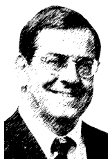
POR Jorge Braga de Macedo

Lisboeta toda a vida, Manuel Jacinto Nunes nasceu no Campo Santana e morreu no Hospital da Luz a 14 de Julho, na companhia da filha e da mulher. Esta, colega algarvia do Instituto Superior